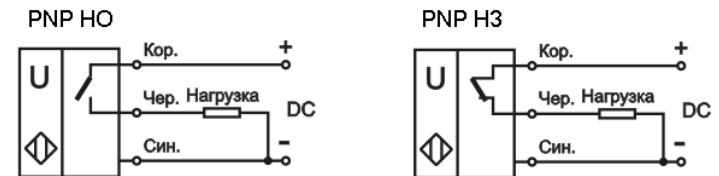
Рис.2. Схема подключения ВБУ